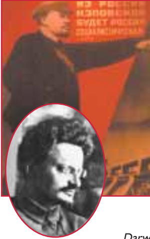
Lenin ve Trotsky